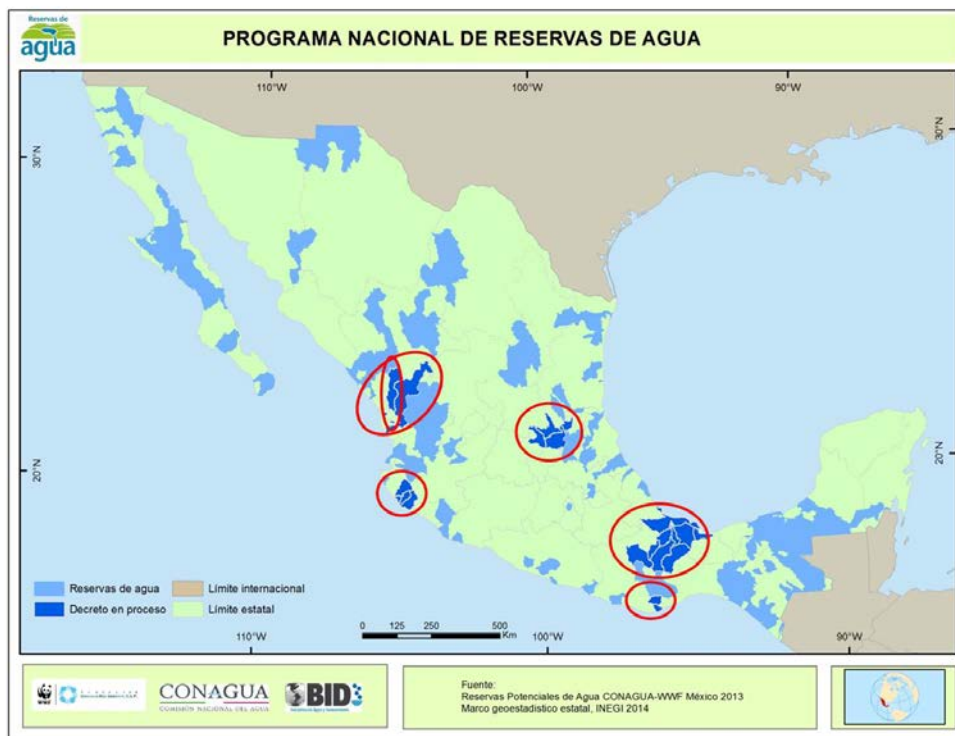
Figura 3. Reservas potenciales de agua y zonas de trabajo piloto